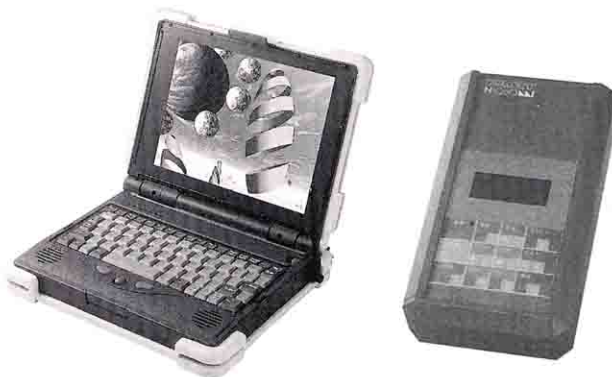
Industrial Portable PC